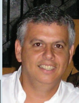
Dir. Comunicação Ronaldo Tedesco Ativa - REDUC