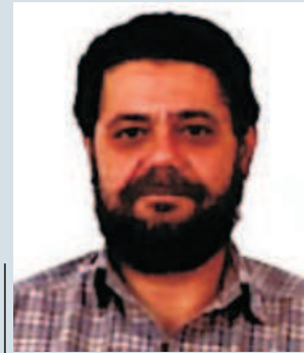
Dir. Cultural Rogério Antunes Ativa - E&P