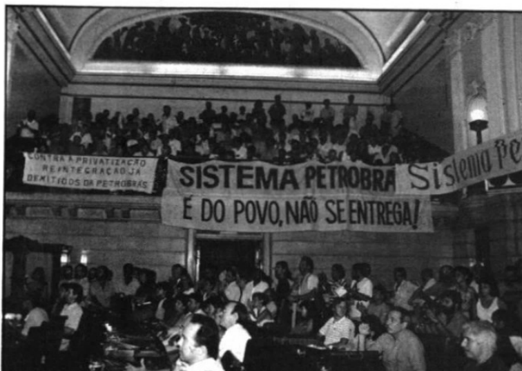
Movimento Nacional em Defesa do Sistema Petrobrás na Câmara Municipal do RJ.

Foi em decorrência de todos estes fatos que surgiu um forte movimento de repúdio aos procedimentos adotados pelo Governo. O movimento, do qual participa a AEPET, é apoiado por diversas entidades da sociedade civil. Neste boletim, mostramos um resumo dos eventos desta campanha que está sendo conduzida em defesa da Petrobrás.