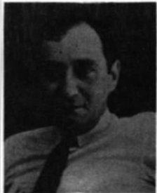
Diretor de Comunicações